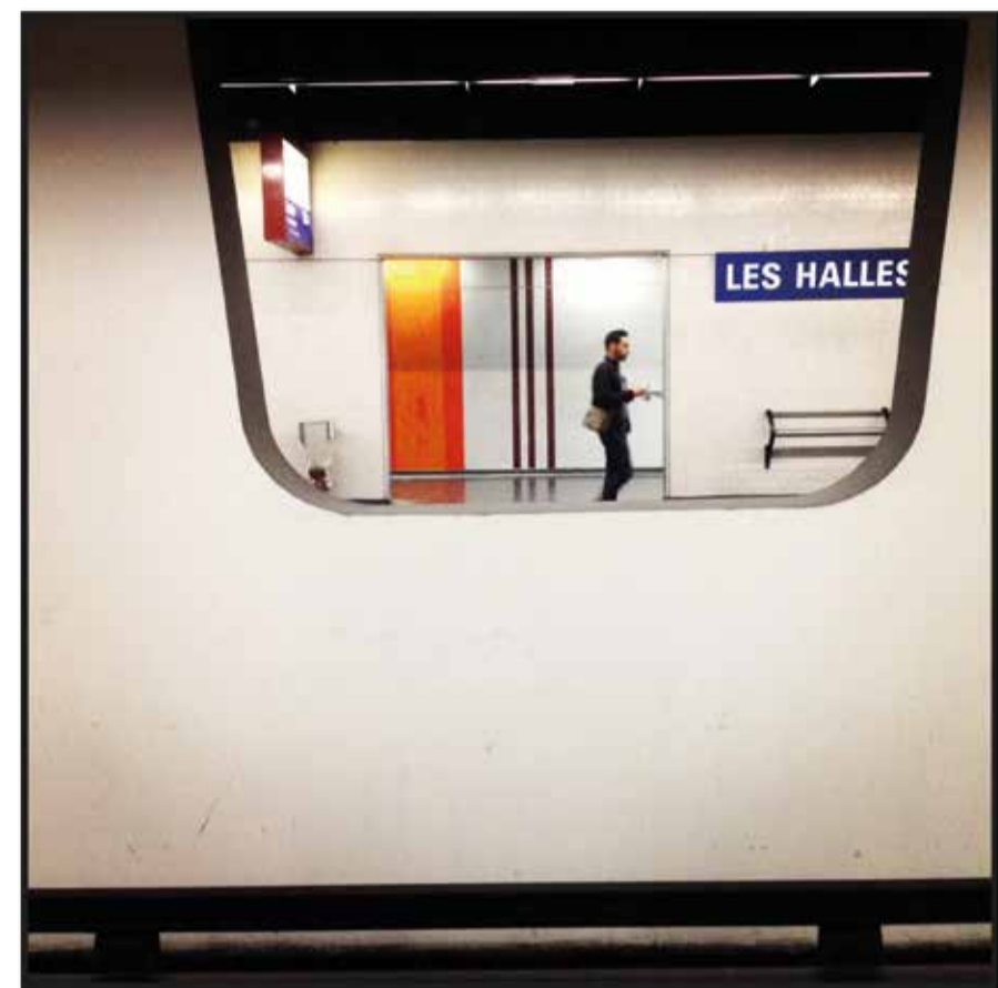
"DIRECTIONS OPPOSÉES" - PARIGI - Massimo Rapanà