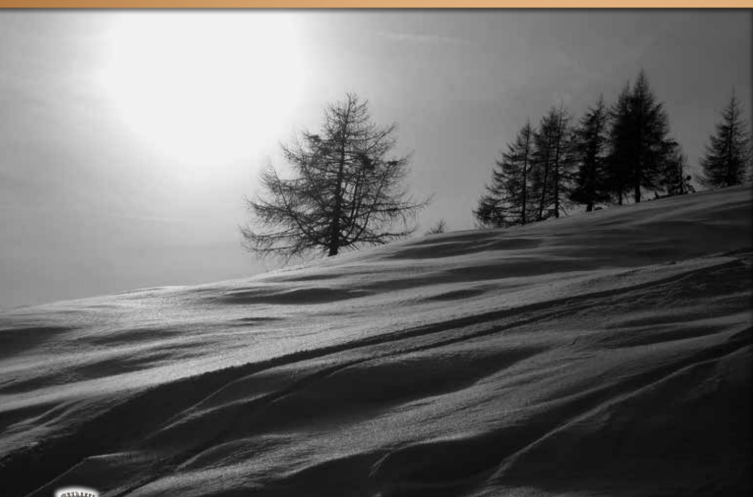
"MORBIDO SILENZIO" - SAN GENESIO, BOLZANO - Giorgio Marizzoli