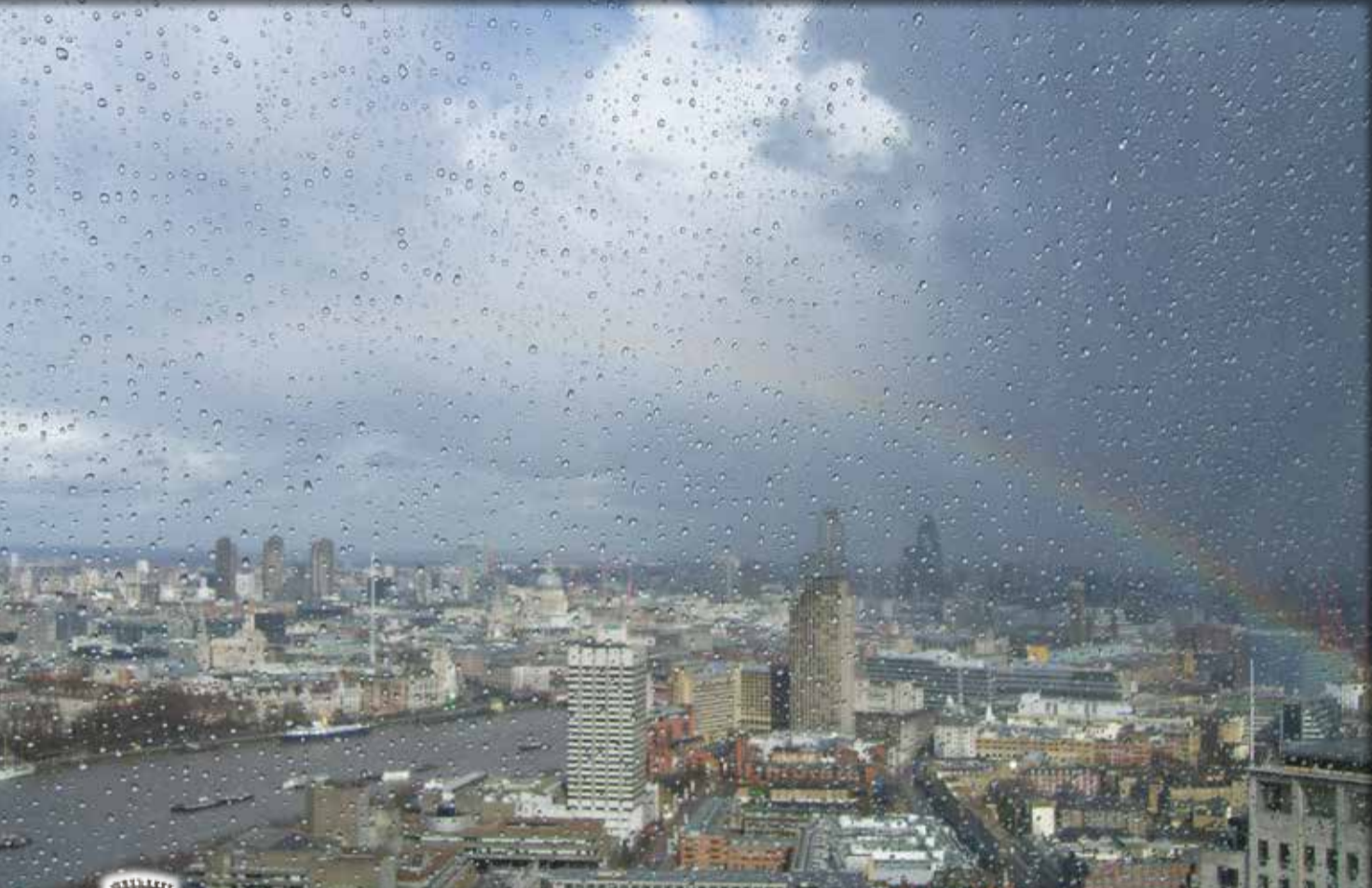
"ARCOBALENO SU LONDRA DAL LONDON EYE" - LONDRA - Luca Manola