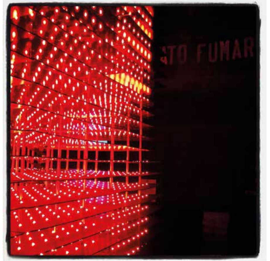
"VIETATO FUMARE" - BIENNALE D'ARTE 2013 VENEZIA - Massimo Rapanà