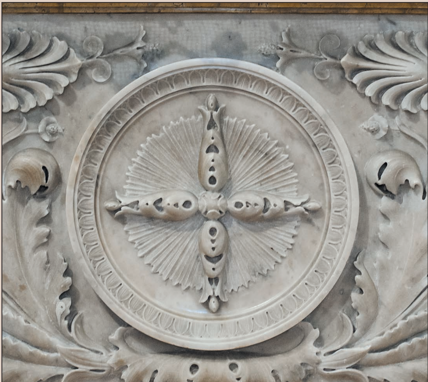
Chiesa parrocchiale SS Salvatore. L'altare maggiore, ricco di specchiature rinascimentali fu realizzato su disegno del Galletti nell'anno 1913. Particolare: formella con croce floreale stilizzata in prezioso marmo apuano.