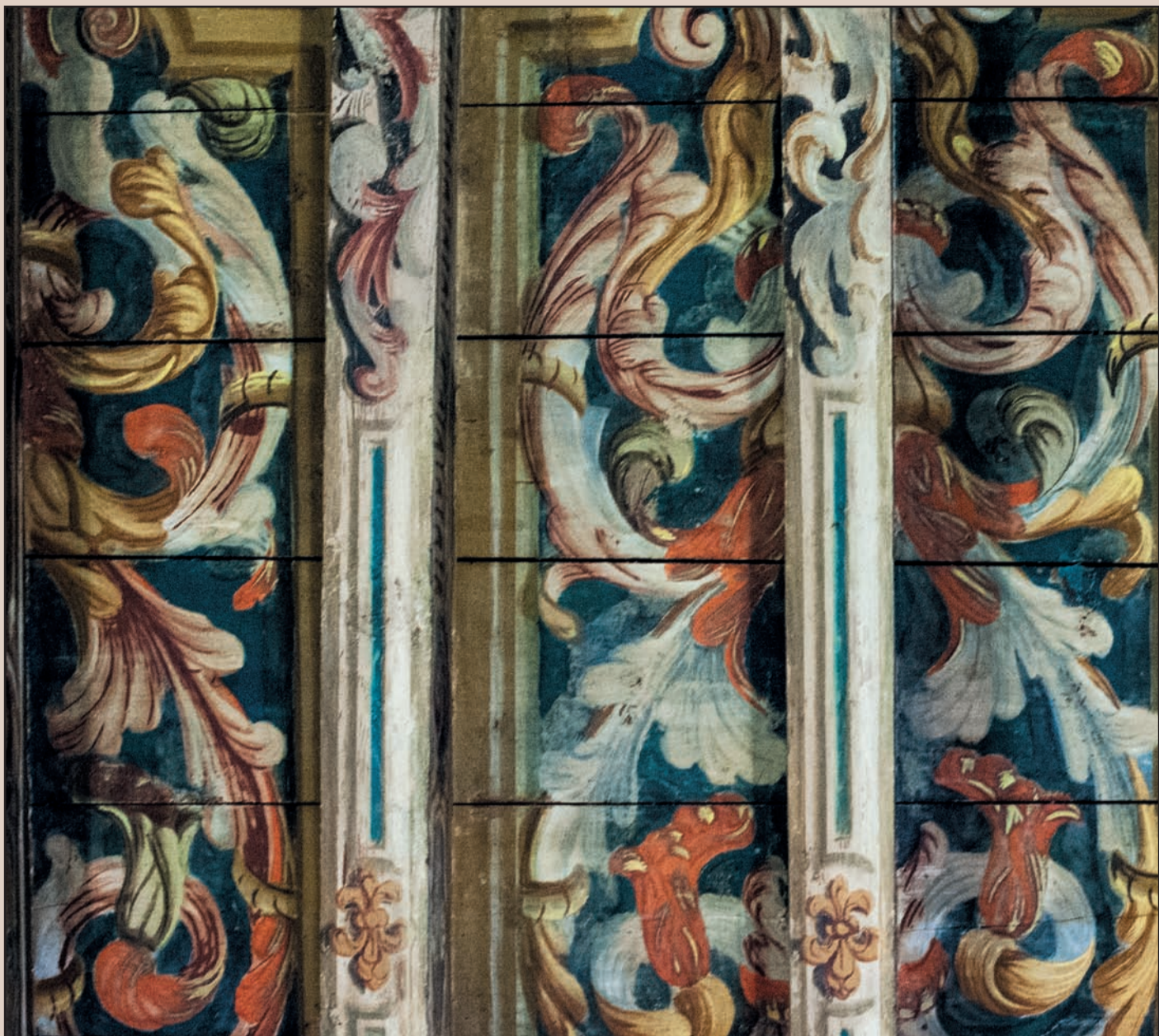
Palazzo Benaglio. Piano primo, ala ovest, Salone dei lavori agresti. Particolare: soffitto ligneo del salone interamente decorato a volute e grottesche dai vivaci colori. Opera di ignoto XVII secolo.