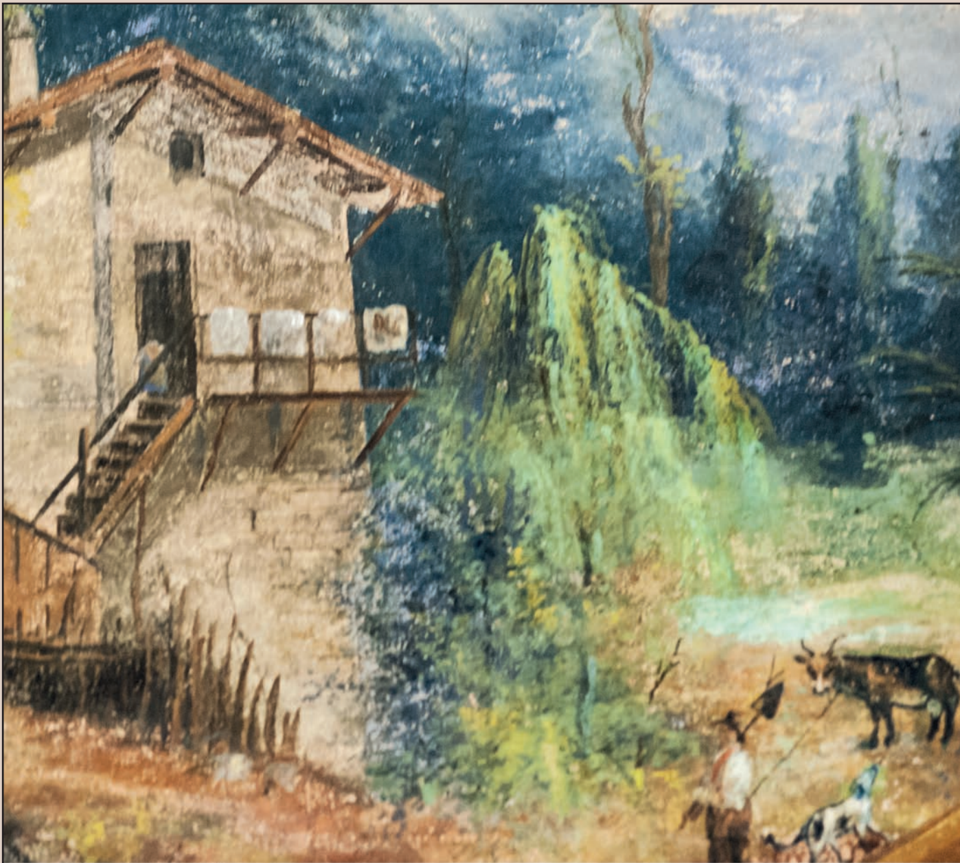
Palazzo Benaglio. Piano terreno, ala est, Sala del camino. Elemento comune negli affreschi del palazzo è il tema delle quattro stagioni. Particolare: riquadro paesaggistico raffigurante l'estate. Salvatoni XIX sec.