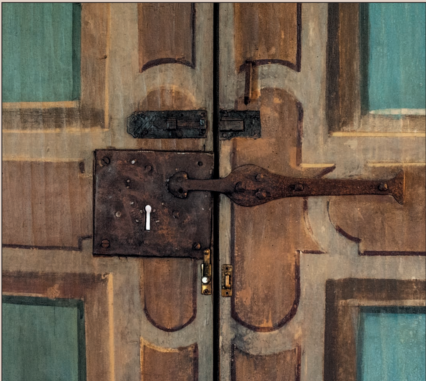
Palazzo Benaglio. Piano primo, ala ovest, Salone dei lavori agrasti. Particolare: chiavistello in ferro, fine XIX sec. a chiusura della porta lignea finemente decorata di epoca settecentesca.