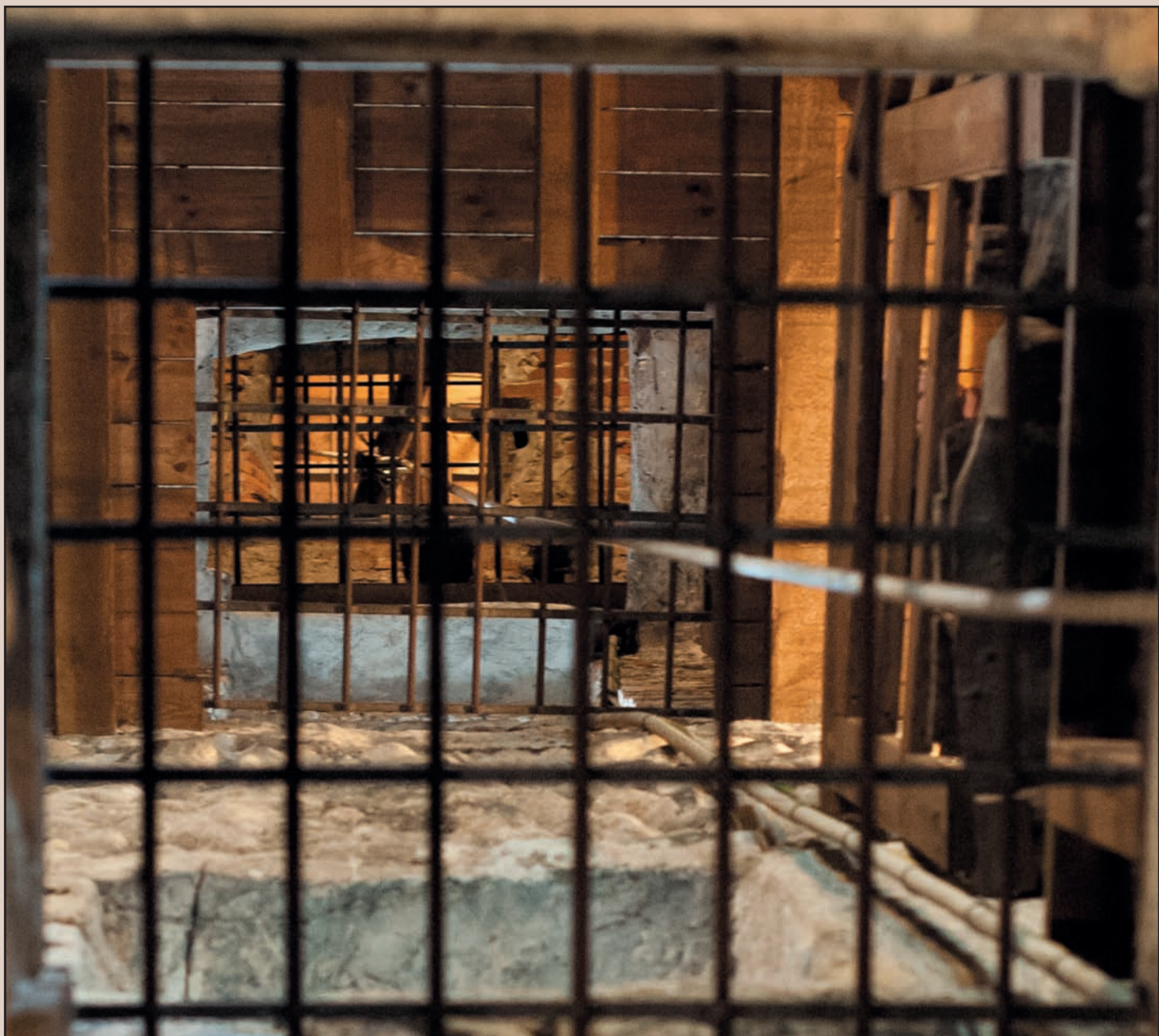
Chiesa parrocchiale SS Salvatore. Torre campanaria, antico batedfredus ligneo del XIII sec. trasformata in struttura muraria di conci irregolari e cotto, donata alla MIA nell'anno 1456 dai da Balsemo. Particolare: grata e struttura lignea interna.