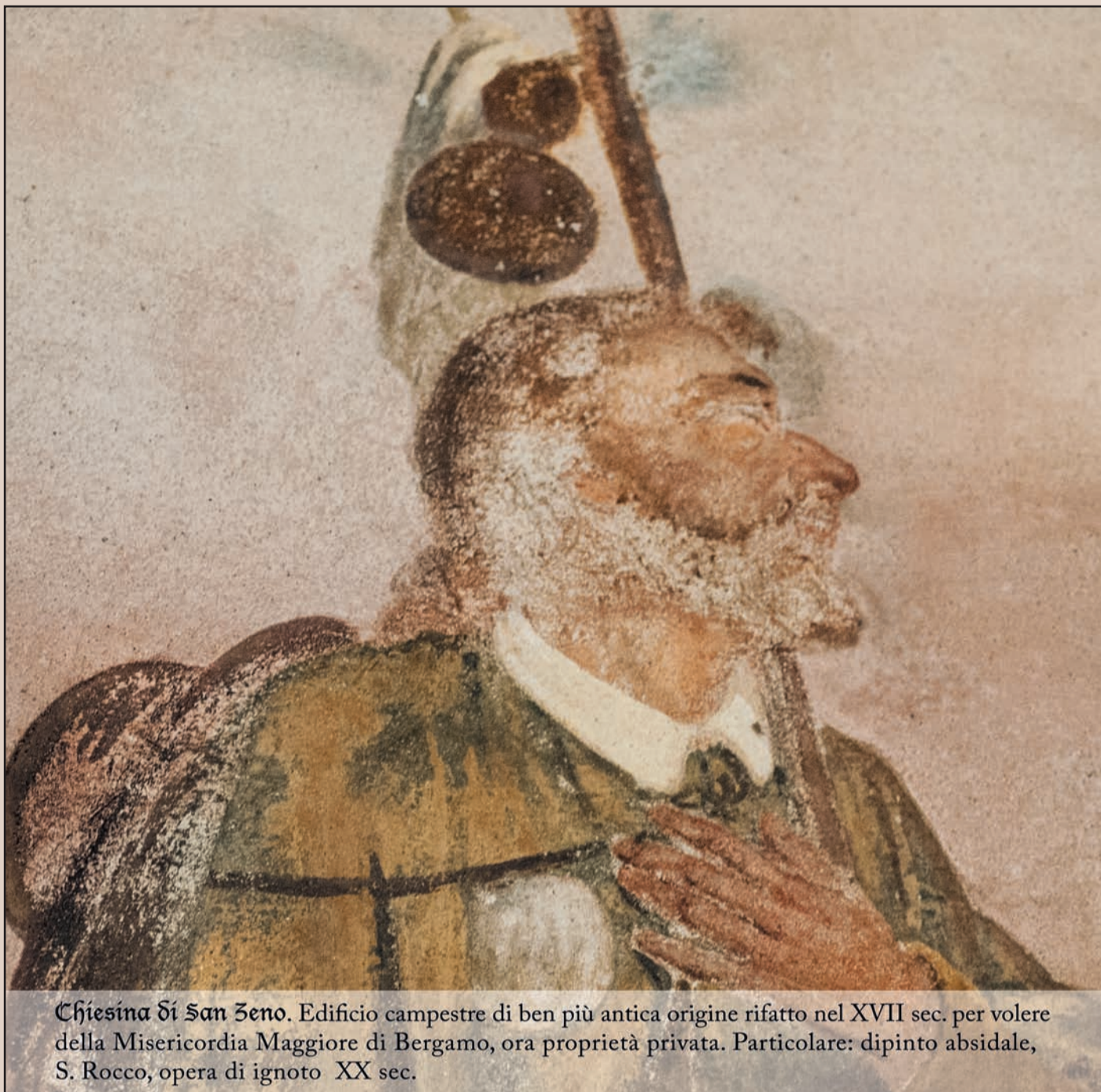
Chiesina di San Zenò. Edificio campestre di ben più antica origine rifatto nel XVII sec. per volere della Misericordia Maggiore di Bergamo, ora proprietà privata. Particolare: dipinto absidale, S. Rocco, opera di ignoto XX sec.