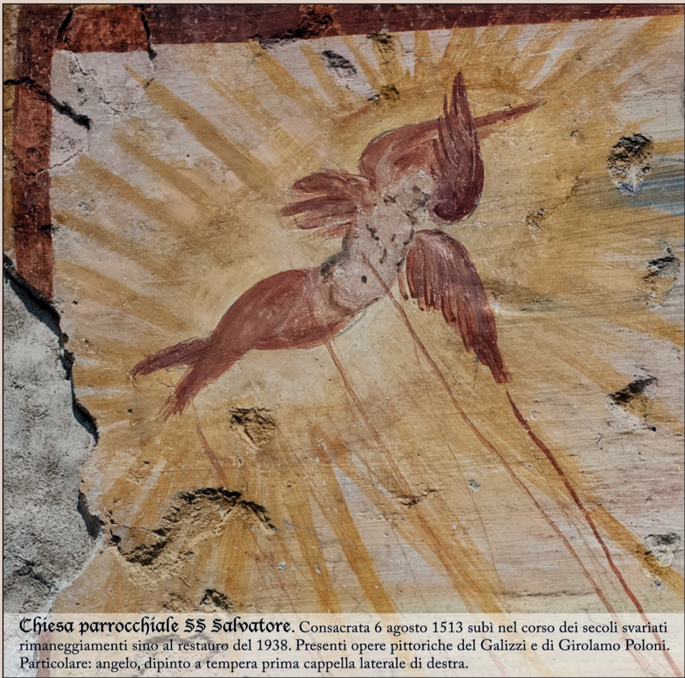
Chiesa parrocchiale SS Salvatore. Consacrata 6 agosto 1513 subì nel corso dei secoli svariati rimaneggiamenti sino al restauro del 1938. Presenti opere pittoriche del Galizzi e di Girolamo Poloni. Particolare: angelo, dipinto a tempera prima cappella laterale di destra.