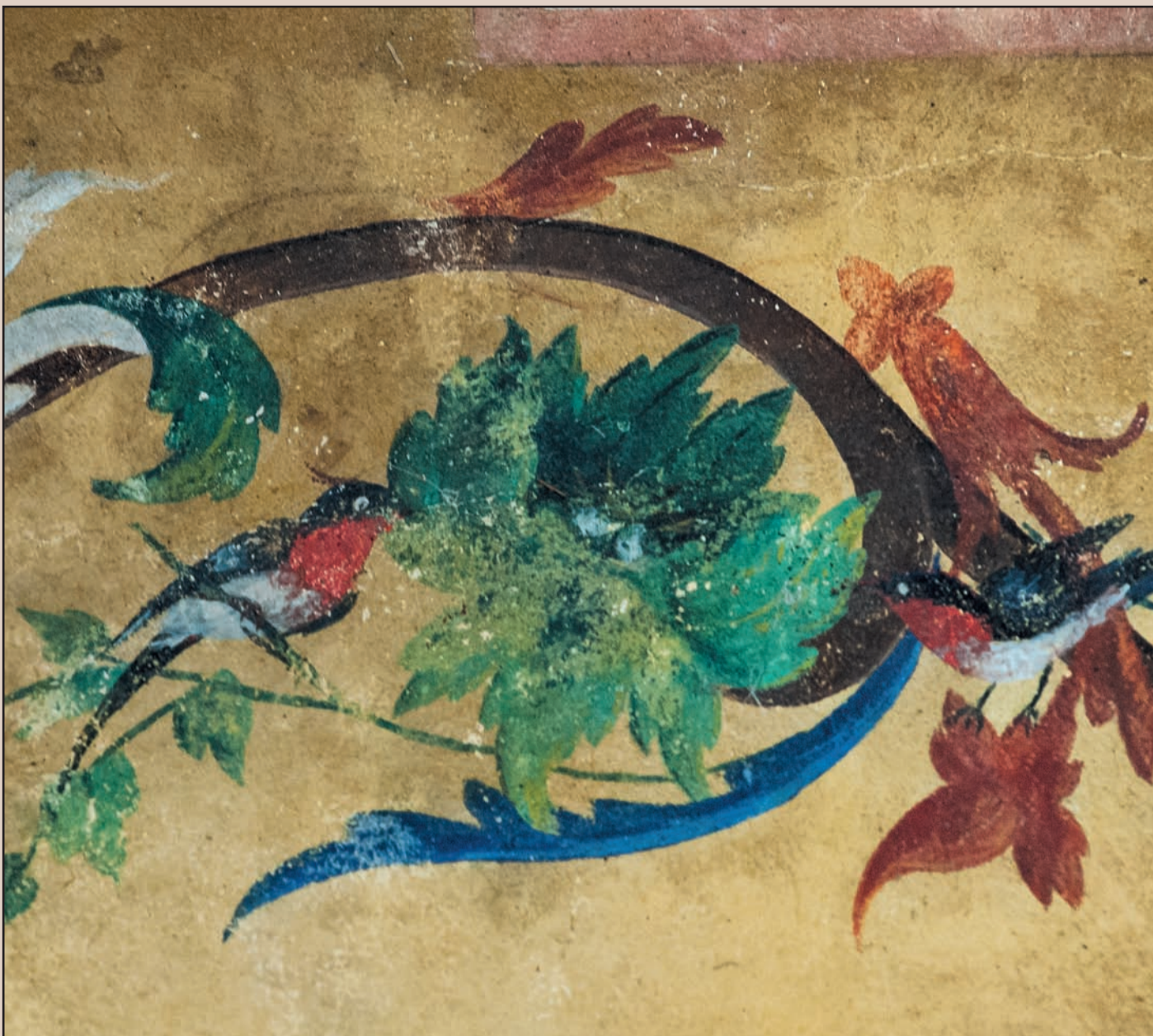
Palazzo Benaglio. Piano terra, porticato del palazzo, già struttura lignea che affiancava a fine Cinquecento la casa torre medioevale trecentesca. Particolare: strappo d'affresco proveniente da casa nobile in Comun Nuovo.