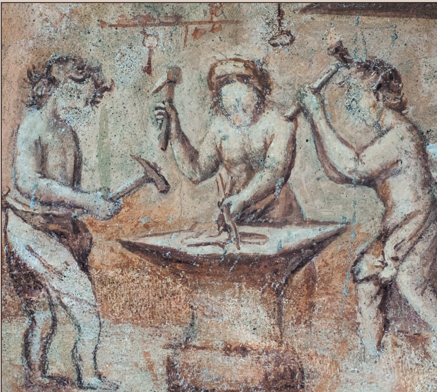
Palazzo Benaglio. Piano primo, ala centrale, Sala del lavoro e dell'ozio. La decorazione pittorica dai tenui colori e l'uso della quadratura crea l'effetto pittorico del trompe l'oeil. Particolare: raffigurazione del lavoro incastonata nell'apparato figurativo. Galliari XVIII sec.