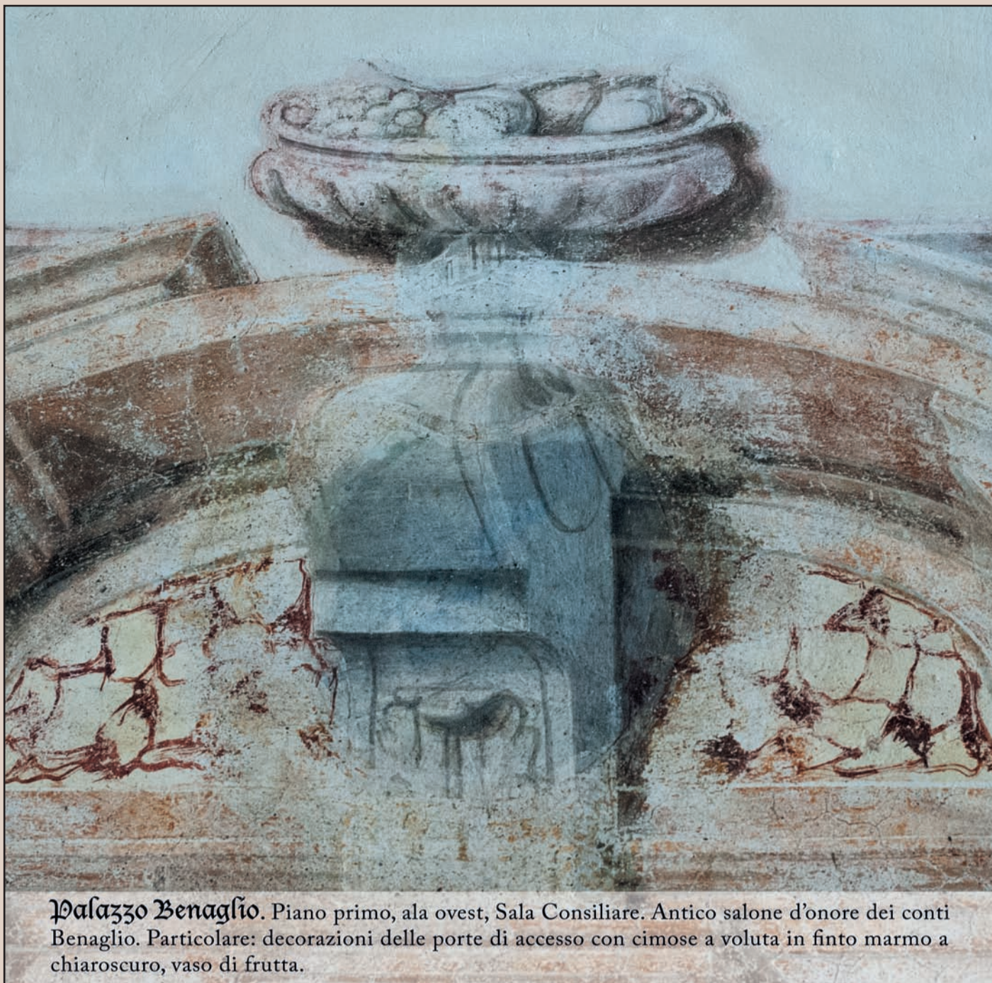
Palazzo Benaglio. Piano primo, ala ovest, Sala Consiliare. Antico salone d'onore dei conti Benaglio. Particolare: decorazioni delle porte di accesso con cimose a voluta in finto marmo a chiaroscuro, vaso di frutta.