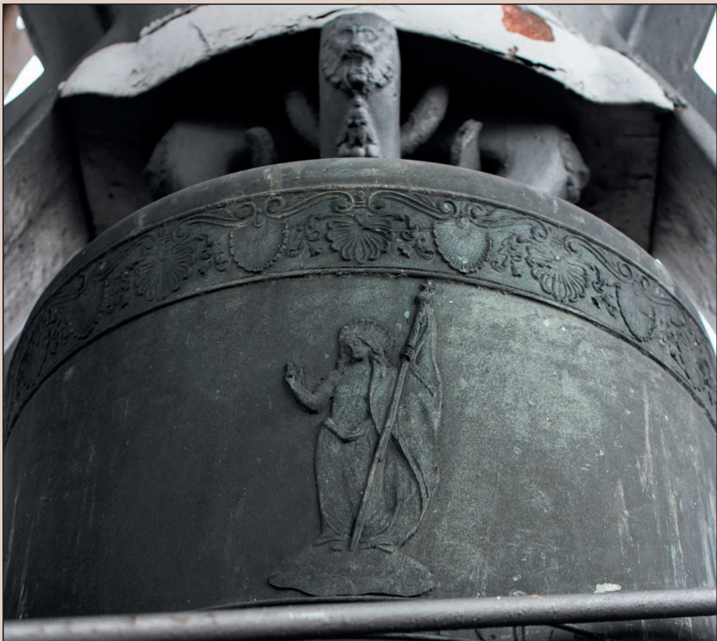
Chiesa parrocchiale SS Salvatore. Chiesa parrocchiale SS. Salvatore. Cella Campanaria. Concerto di 8 campane in Do3 fuse da Pruneri nel 1884, rifuse da C. Ottolina nel 1952 Do3 e Re3. Particolare: Il SS. Salvatore.